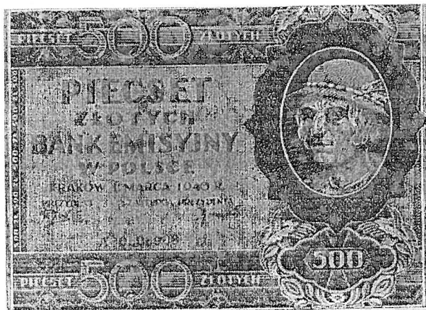
500 złotych z 1940 roku emitowanych przez Bank Emisyjny w Polsce, tzw. góral

tzw. złote krakowskie, na obszarach zajętych przez Związek Sowiecki – ruble, a na Spiszu i Orawie – korony słowackie. Ludność posiadała też przedwojenne złote, pojawiły się także złote emitowane przez władze. Konieczna zatem była wymiana pieniędzy. Dokonywano jej w poszczególnych rejonach wyzwalanego kraju w różnym czasie (albo w ogóle, jak na tzw. Ziemiach Odzyskanych) i tylko do określonej wysokości, przez co ludność straciła część majątku 22 .