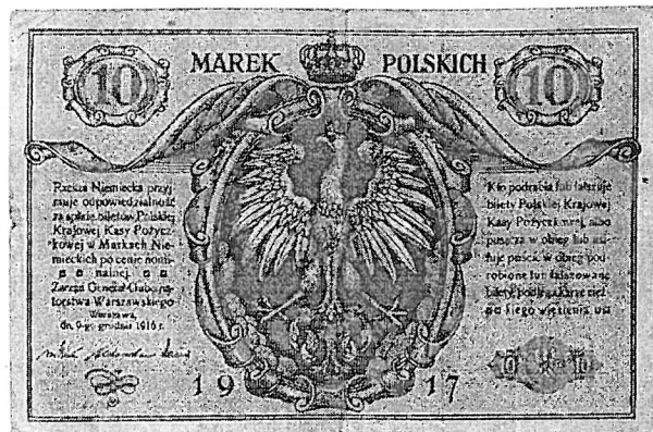
10 marek polskich emitowanych przez Polską Krajową Kasę Pożyczkową

„Rok 1924 dał wielkie świadectwo naszej wartości jako państwa” 10 . Bank Polski S.A. i złote Nowy premier widział konieczność szybkiego działania i wymusił na sejmie udzielenie prezydentowi Stanisławowi Wojciechowskiemu (a faktycznie sobie) półrocznego upoważnienia do wydawania rozporządzeń z mocą ustawy. Miało to zdynamizować podejmowane działania, uprościć i skrócić procedury legislacyjne. Aby zrównoważyć budżet, rząd został upoważniony do podwyższenia stawek podatkowych i celnych, przyspieszenia terminu płatności i uproszczenia postępowania przy ściąganiu podatków na rzecz państwa (głównie podatku majątkowego: nadzwyczajnej daniny na rzecz państwa świadczonej przez najbogatszą część społeczeństwa). Chciano również zaoszczędzić na wydatkach